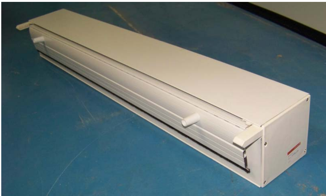
Figura 1: Foto de uno de los cajones recepcionados

El día 10 de noviembre de 2009 se recibieron en CIDEMCO cuatro cajones de persiana de PVC con un máximo de 7 lamas, enviados por la empresa EXPALUM, referenciados como «AISLABOX ULTRA » de dimensiones (1.200 x 160 x 160) mm