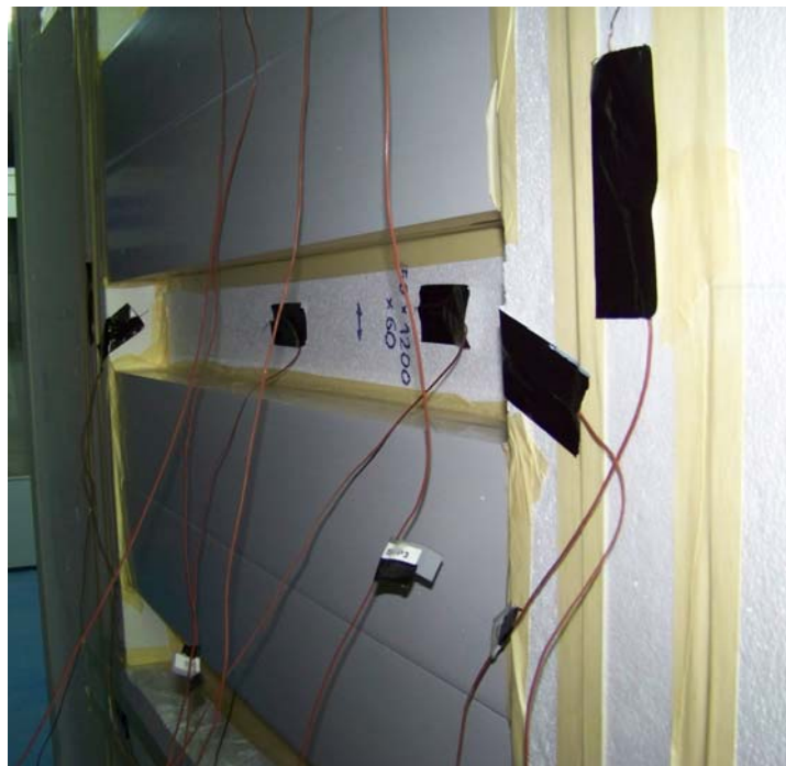
Figura 2: Muestras de “AISLABOX ULTRA” colocadas en el banco de ensayo.

Se utiliza como muestra cuatro cajones de persiana para cubrir un 30% del área de la caja de medida y la separación entre cada par de cajones es de al menos 150 mm.